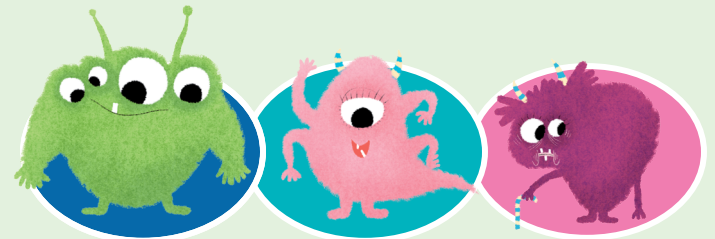
Bili Ark Rosie Ark Mamie Ark