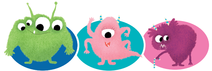
Bili Ark Rosie Ark Mamie Ark