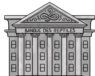
la BANQUE DES REPTILES