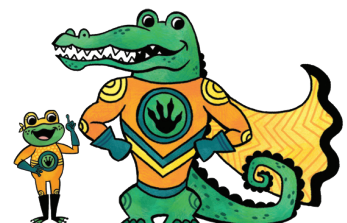
Zoé-Masquée et Super-Cro