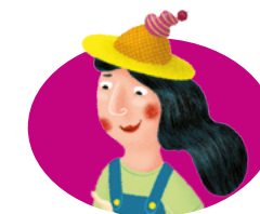
madame Su crée