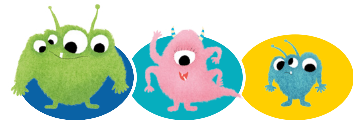
Bili Ark Rosie Ark Gobi Ark